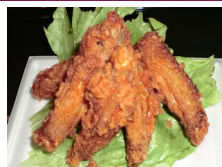
ピリ辛ハーフチキン