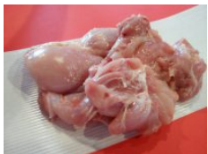
若鶏皮つきもも肉