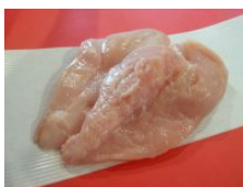
若鶏皮なしむね肉